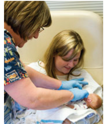
Ayudamos a las madres a iniciar la lactancia durante la hora siguiente al parto.

Todas nuestras enfermeras la ayudarán a usted y a su bebé a empezar a dar el pecho. Tenemos también especialistas en lactancia, que son enfermeras tituladas con años adicionales de estudio y capacitación, de modo que puedan ayudar con problemas complejos o poco comunes de la alimentación al pecho.