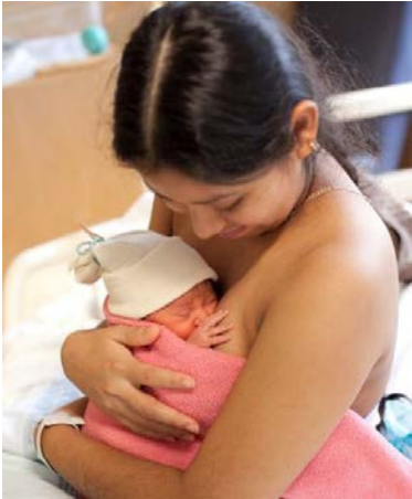
At UWMC, we encourage mothers to breastfeed their babies.