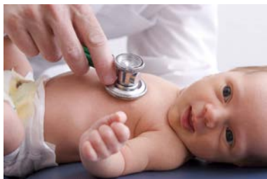
Your baby will need to be seen for well-baby checkups and immunizations during the first year.

Please also read the chapter “Car Seat Safety” in this book.